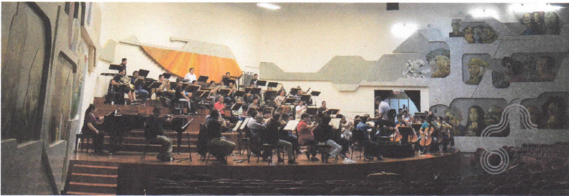
10. Participé en la presentación del VIII Concierto de la Temporada Popular, realizado el día miércoles 19 de septiembre de 2018, en el Teatro del IRTRA Petapa.